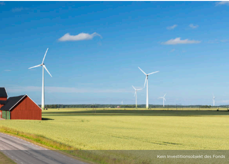
Kein Investitionsobjekt des Fonds

Insgesamt wurden durch Wind- und Solarparks der EURAMCO Gruppe rund 3 Millionen MWh Strom erzeugt und 1,6 Millionen Tonnen CO 2 -Emissionen vermieden: