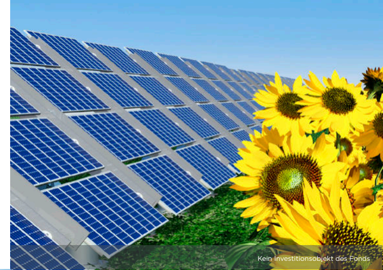
Kein Investitionsobjekt des Fonds

Prognostizierte Gesamtausschüttung von 145 % , bei einer Laufzeit von 10 Jahren