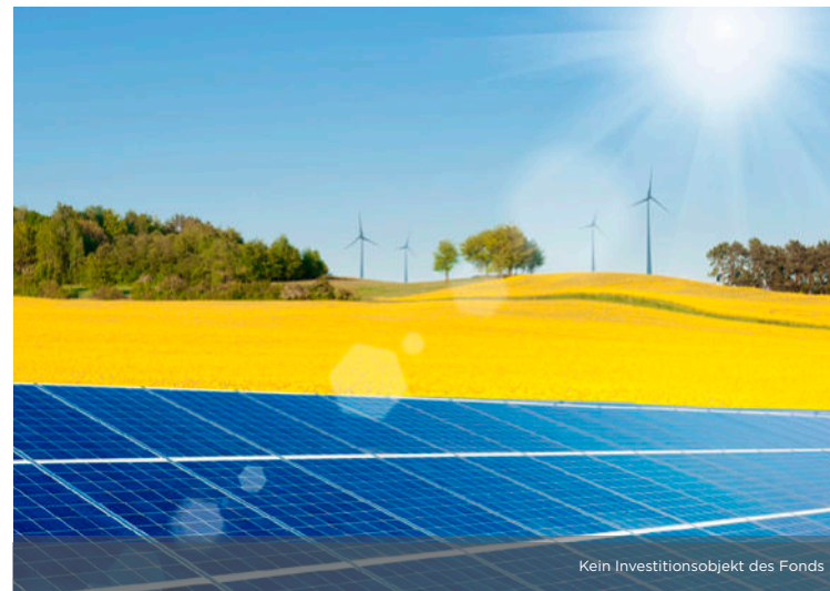
Kein Investitionsobjekt des Fonds